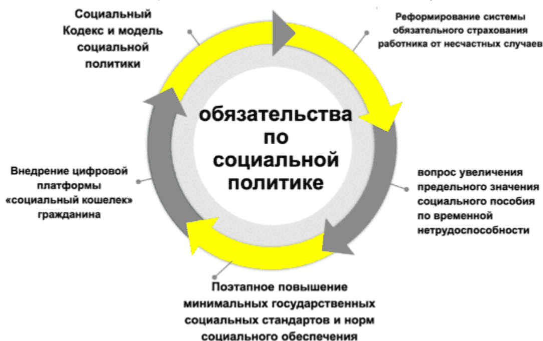
Рисунок 4. Ключевые обязательства сторон Генерального соглашения по социальной политике © Хасенов М.Х., 2021

В случае положительного рассмотрения вопросов реформирования будут достигнуты следующие результаты: