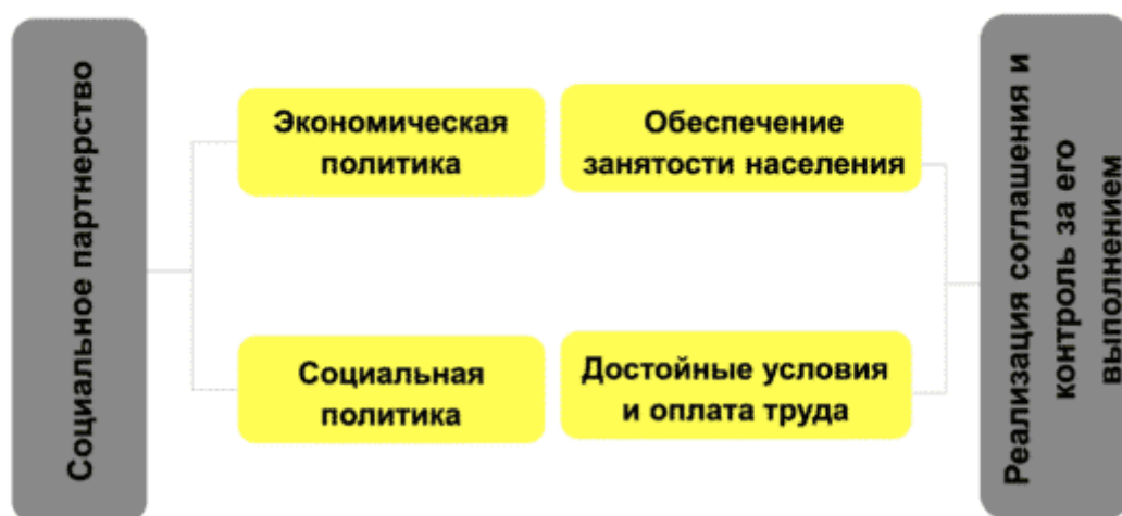
Рисунок 1. Структура Генерального соглашения о социальном партнерстве на 2021-2023 гг.

Таким образом, по своему содержанию Генеральное соглашение выходит далеко за пределы трудовых отношений. Соглашение охватывает экономическую и социальную политику, тем самым демонстрируя масштабность и действенность модели социального партнерства, как механизма согласования взаимных обязательств институтов власти и гражданского общества в социально-экономической сфере.