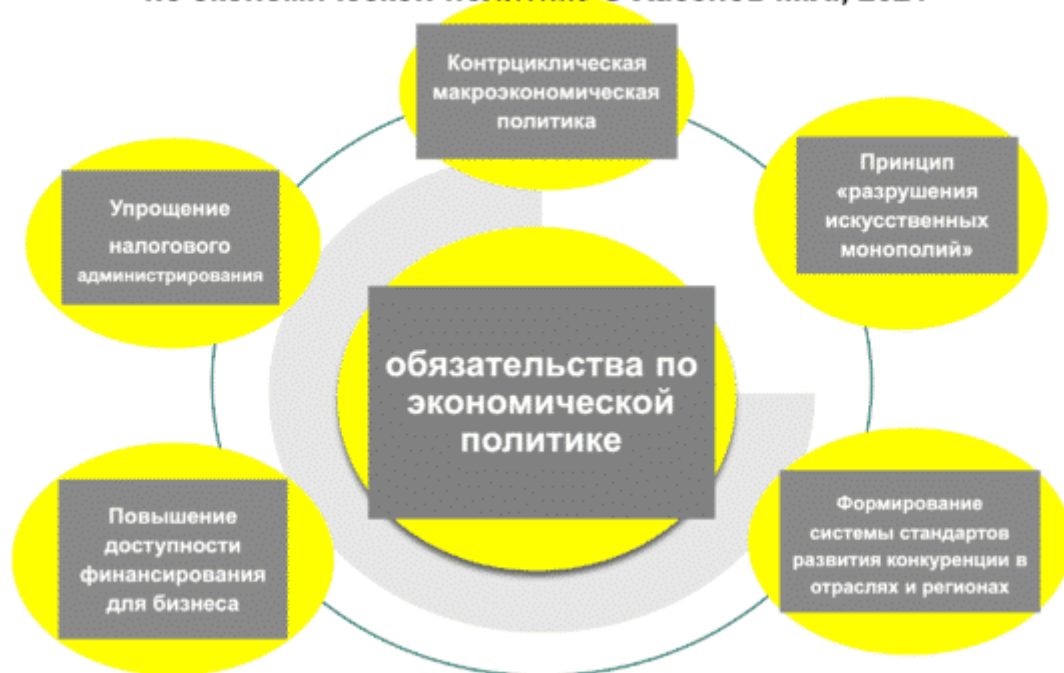
Рисунок 3. Ключевые обязательства сторон Генерального соглашения по экономической политике © Хасенов М.Х., 2021

Для сравнения, в предыдущем Генеральном соглашении (на 2018-2020 годы) обязательства в области экономической политики сводились к содействию ускоренной технологической модернизации экономики и улучшению бизнес-среды. Наиболее предметно это выражалось в принятии совместных системных мер по дерегулированию бизнеса, либерализации процедур контроля и надзора за деятельностью субъектов частного бизнеса и расширении мер государственной поддержки МСБ. Никакие макроэкономические показатели определены не были.